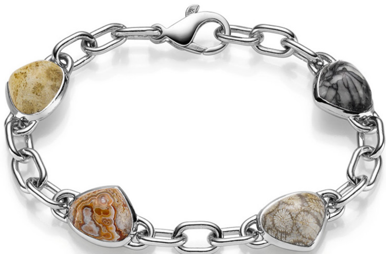
1 NITSCH Armband BUNTE LIEBLINGE „On the rocks“, Pinolith, Fossile Koralle grau, Crazy Lace Agate, Fossile Koralle gold, 4.950,- 2 NITSCH Ringe BUNTE LIEBLINGE „On the rocks“, Fossile Koralle blau, Pinolith, Fossile Koralle grau ab 1.400,-